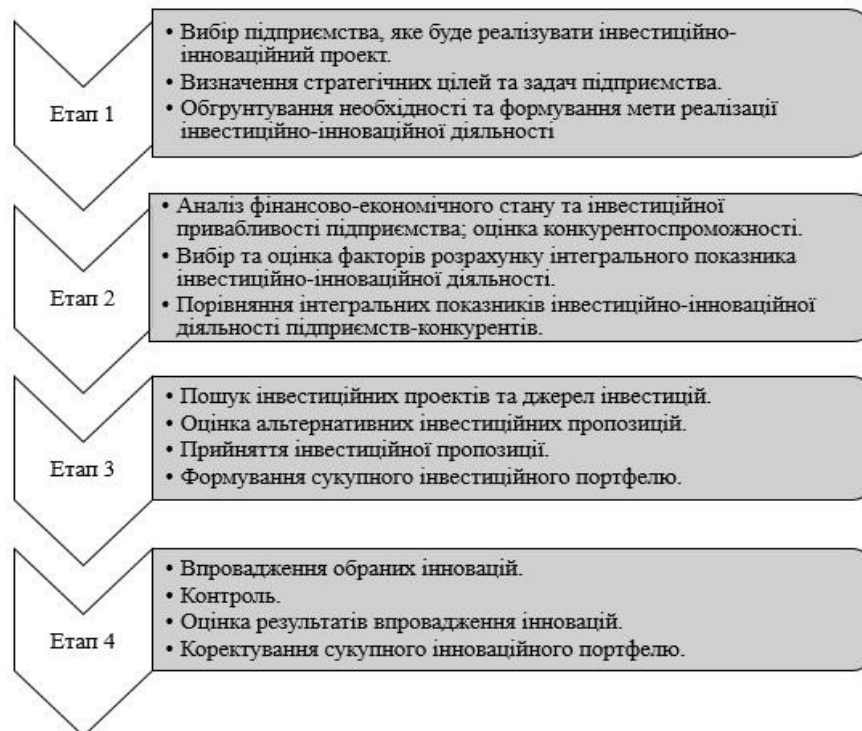
Рис. 3 – Механізм інвестиційно-інноваційної діяльності для промислових підприємств.

Інвестиційно-інноваційний механізм забезпечення конкурентоспроможності підприємства являє собою сукупність методів та способів управління, які дають можливість підприємству мати стійку позицію на ринку, залучати та зберігати не лише інвесторів, а й споживачів при реалізації основної мети своєї діяльності. Щоб краще уявити таку систему, була складена схема механізму інвестиційно-інноваційної діяльності, яка представлена на рис. 3. Заходи з оцінки інвестиційної привабливості у рамках реалізації інвестиційно-інноваційного механізму забезпечення конкурентоспроможності підприємства має складатися з основних етапів, які націлені на вибір факторів досягнення поставлених стратегічних і оперативних цілей, пошук альтернативних інноваційних пропозицій та коректування сукупного інноваційного портфелю підприємства. Усе це дозволяє підприємству підвищити об'єми та ефективність економічної діяльності за допомогою залучених інвестиційних коштів. При формуванні такого механізму необхідно враховувати особливості державного регулювання ринкових відносин та фактори саморегуляції ринку. Функціонування такого механізму перш за все залежить від сучасних ринкових умов, кон'юнктури на певному товарному ринку, його специфіки та динаміки розвитку.