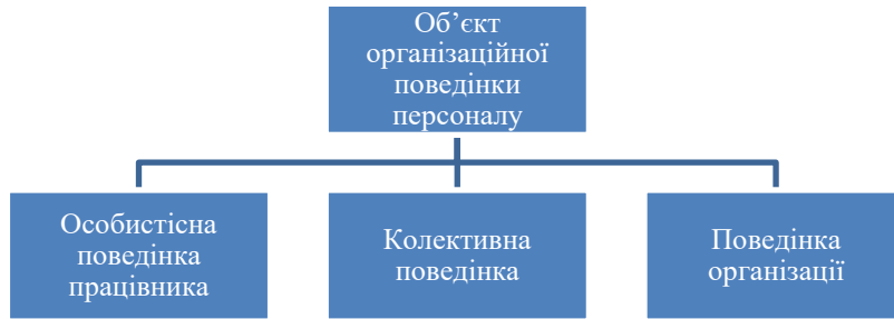
Рисунок 1. – Об'єкти організаційної поведінки

Тому вважаємо, що об'єктом аналізу організаційної поведінки є особистісна поведінка персоналу організації; колективні методи поведінки організаційних груп у мікросередовищі, а також поведінка організації у макросередовищі загалом (рис. 1).