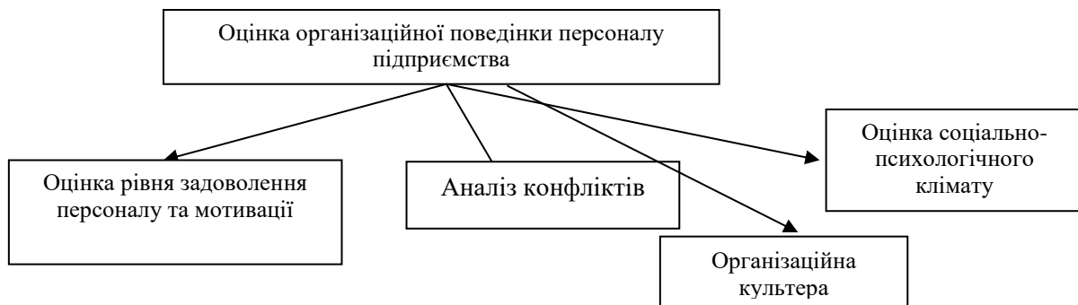
Рисунок 4. – Напрямки аналізу організаційної поведінки персоналу *сформовано автором за результатами досліджень

З метою формування ефективної системи менеджменту, що забезпечує організаційні процеси, потрібно акцентувати увагу на факторах, які мають прямий вплив на працівників, тобто оцінці факторів впливу на поведінку персоналу. Аналіз літературних джерел, що стосуються дослідження сутності та аналізу поведінки персоналу, дозволяє зробити висновок, що ключовими факторами, які мають вплив на формування організаційної поведінки є рівень задоволеності та мотивації працівників, тип та рівень сформованості організаційної культури, наявність конфліктів та причин їх виникнення, соціально-психологічний клімат у колективі. Відповідно напрямки оцінки організаційної поведінки працівників представлено на рисунку 4.