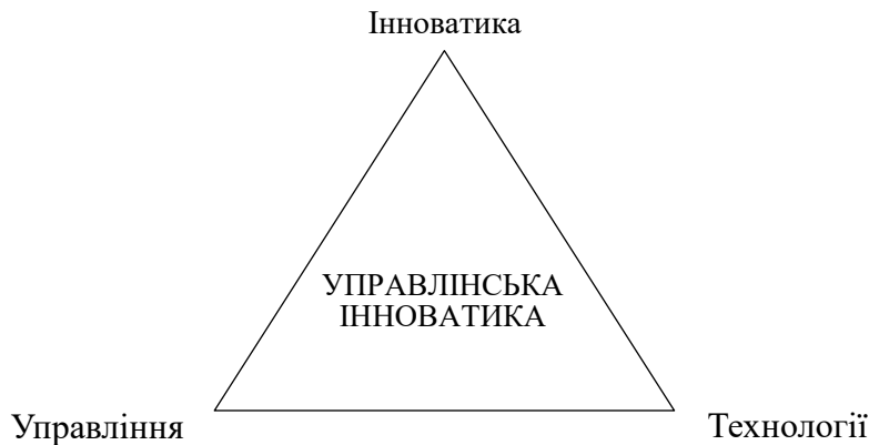
Рис. 1. Управлінська інноватика в синтезі наук, що її формують

Результати. Управлінська інноватика поєднує в собі найкращі риси таких наук як управління, інноватика та технології (рис. 1).