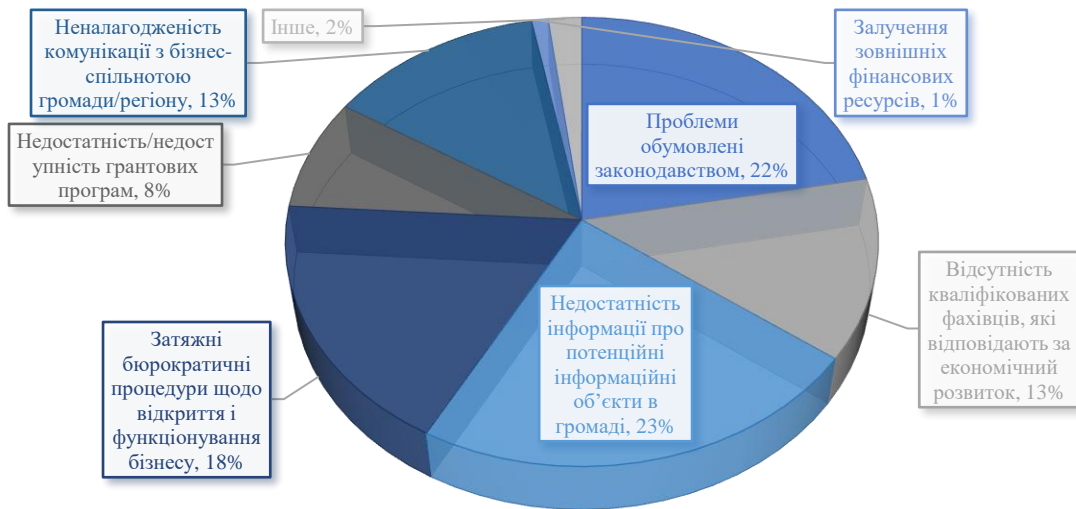
Рис. 2. Перешкоди залучення зовнішніх фінансових (інвестиційних) ресурсів для громади/регіону [6]

Зауважимо, що до основних перешкод нарощення регіонами ресурсної бази інвестицій можна віднести такі: корупція, адміністративні перепони для функціонування бізнесу, «недостатність інформації щодо потенційних інвестиційних об'єктів, які наявні в громаді (кадастр промислових земель, реєстр існуючих об'єктів нерухомості тощо); проблеми, які зумовлені недоліками у законодавстві (зокрема, часті зміни в нормативно-правових актах стосовно діяльності територій); тривалі бюрократичні процедури, які стосуються започаткування та функціонування суб'єктів підприємництва; брак кваліфікованих спеціалістів, які відповідають за економічний розвиток громади та залучення інвестицій; не налагодженість комунікації з бізнес спільнотою громади/регіону; недостатність/недоступність грантових програм [5,с. 42; 6, с. 317].