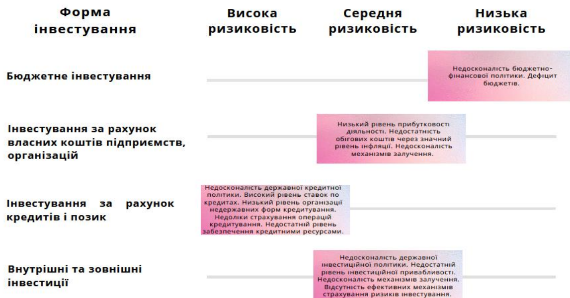
Рис.1. Форми інвестиційно-інноваційного забезпечення розвитку регіону

Форми інвестиційно-інноваційного забезпечення розвитку регіону за своєю квінтесенцією визначають джерело інвестування (1).