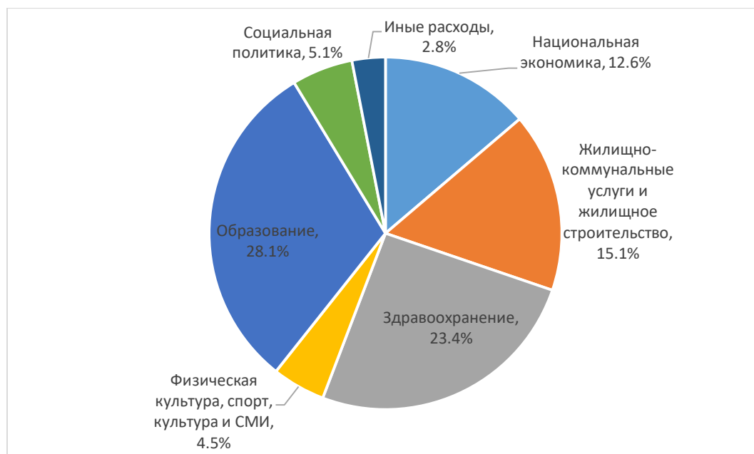
Рисунок 1 – Структура расходов местных бюджетов Республики Беларусь в 2019 году

Структура расходов местных бюджетов Республики Беларусь представлена на рисунке 1.